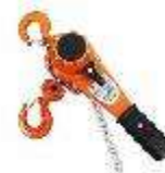
多功能牵引手板葫芦